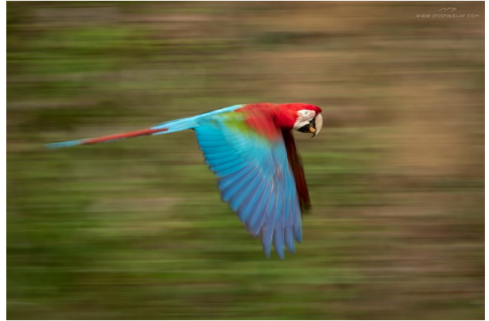
MACAW / GUACAMAYA ( Ara macao ) AMAZONAS, PERÚ