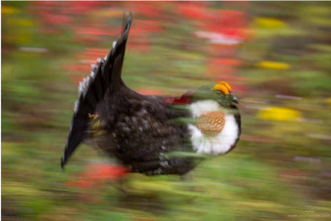
GROUSE / UROGALLO ( Dendragapus fuliginosus ) CASCADE MOUNTAINS, CANADA