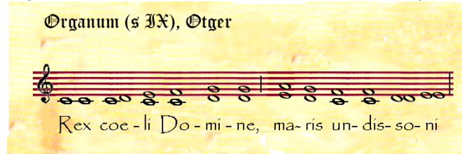
Rex coeli de Otger de Saint Armand , s. IX, en edición moderna que imita al pergamino; el órgano es la voz inferior acompañante.

*Organum es una forma de polifonía occidental primitiva que alcanzó su apogeo en la Escuela de Notre Dame de París , centro del Ars Antiqua (s. XI y XII). Está basada en la repetición paralela de la misma melodía, nota por nota, pero generalmente a una distancia de cinco notas (quinta justa).