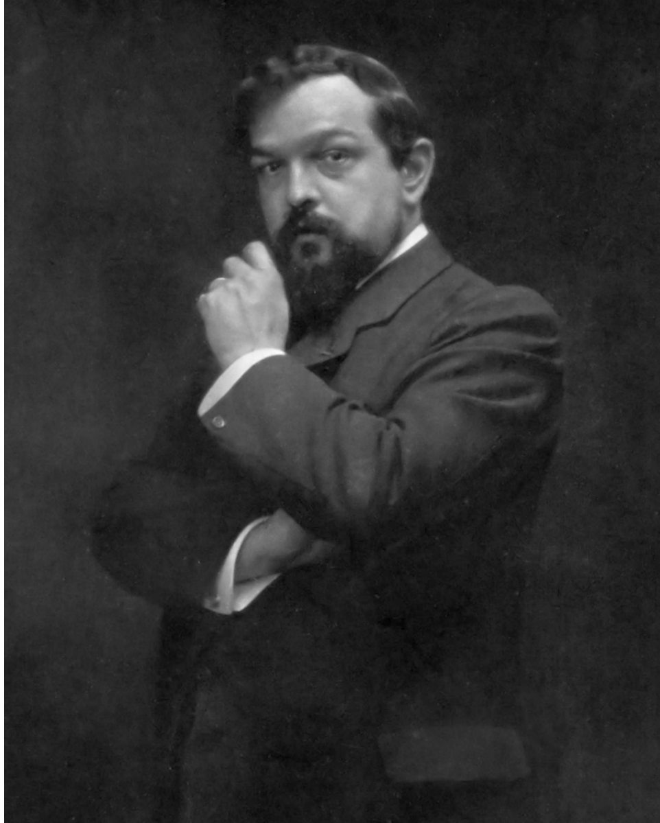
Claude A. DEBUSSY (1908)